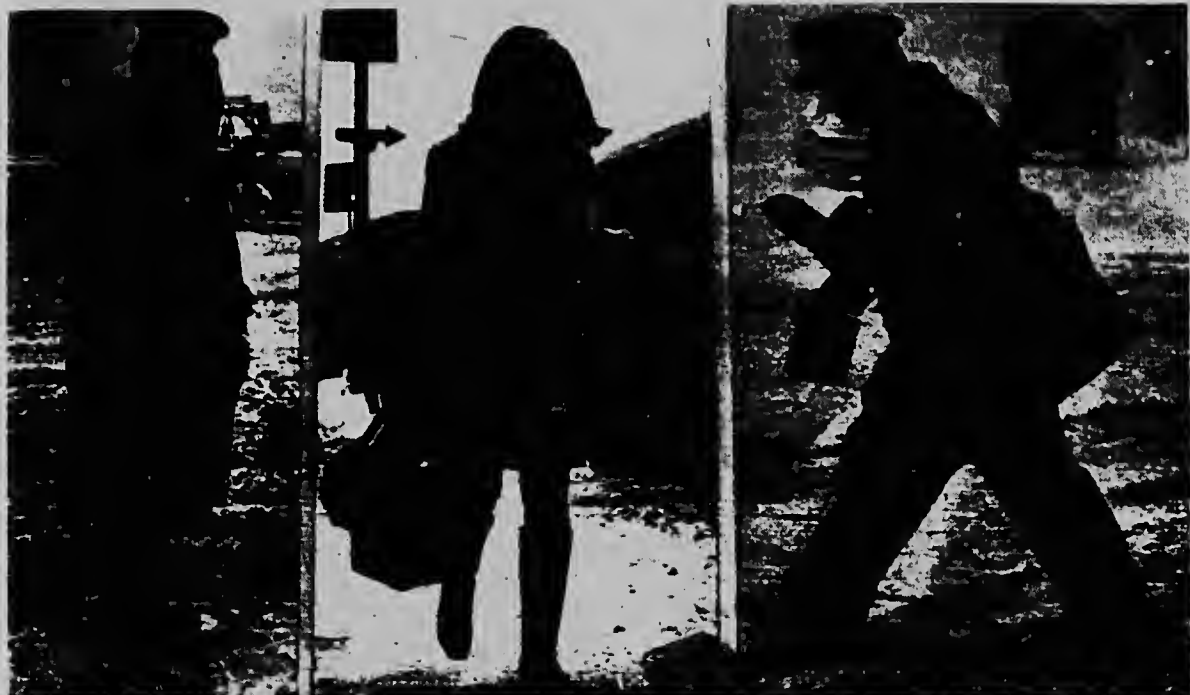
Na New York poliznan mester a bisti tur loke nan tabatin na panja diki pa por a hasi nan trabao. Un brievener besteller mester a paketi su mes pa por a entregá su cartanan y ta pesey ta pa nos incomprendible con contrario na tur esaki, meimei e mucha muher ta enfrenta e tormenta sin sombré y cu un miniskirt. Anto nan ta papia di sexo debil